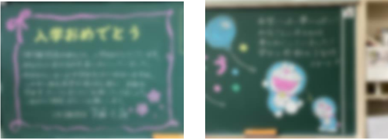
・担任からのメッセージ

4月7日(金)、2・3年生、新入生保護者、ご来賓の方々に見守られる中、75名の1年生を迎えました。